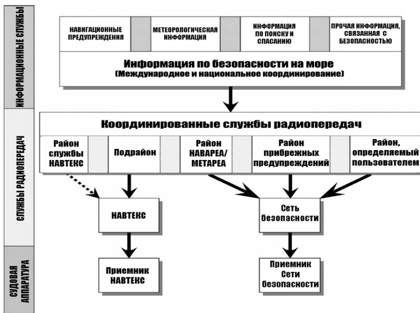
Рис. 1. Организация службы ИБМ ГМССБ